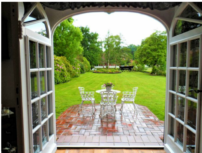
Blick aus dem Wohnzimmer