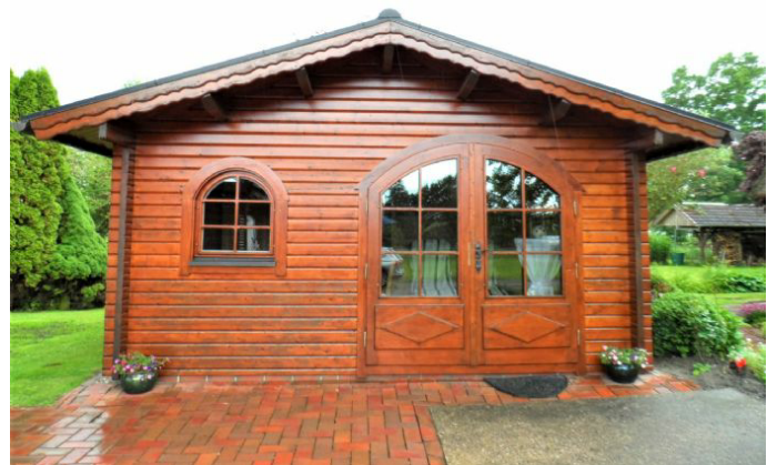
Gartenhaus mit Sauna