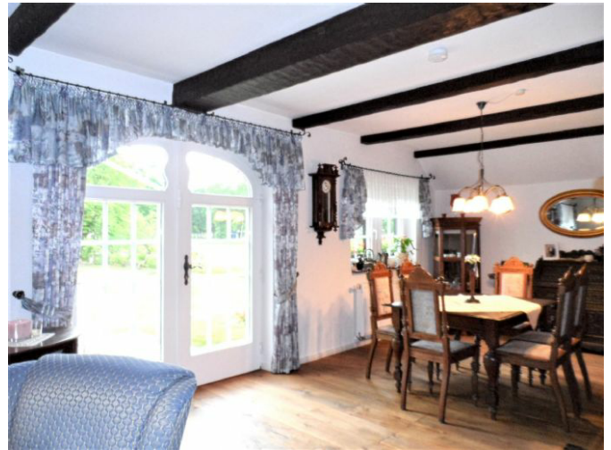
Wohnen / Essen