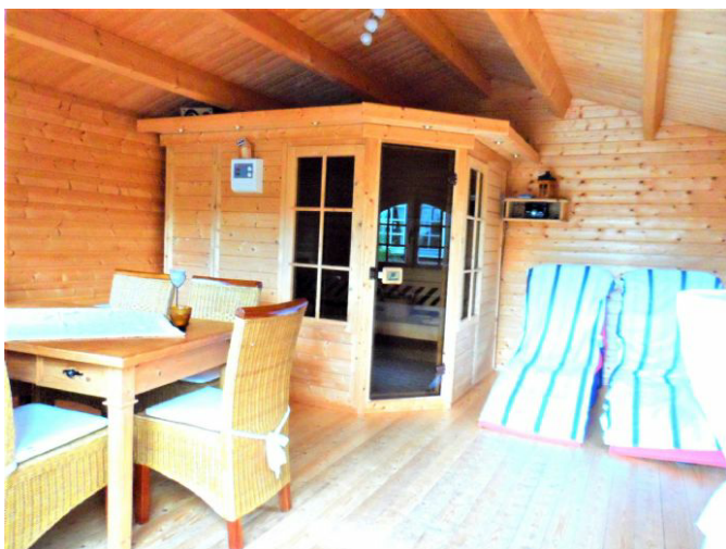
Sauna / Ruhebereich