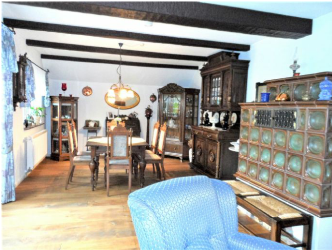
Wohnen / Essen