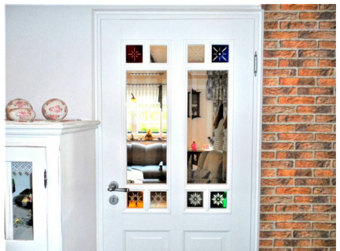
Tür zum Wohnzimmer