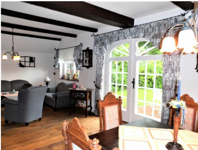
Wohnen / Essen