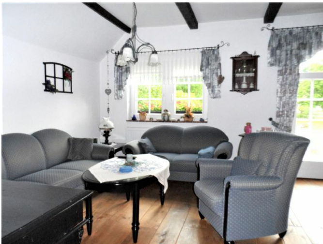
Wohnen / Essen